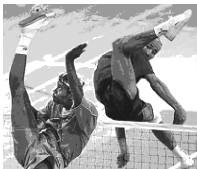
Plauschspieler im Einsatz